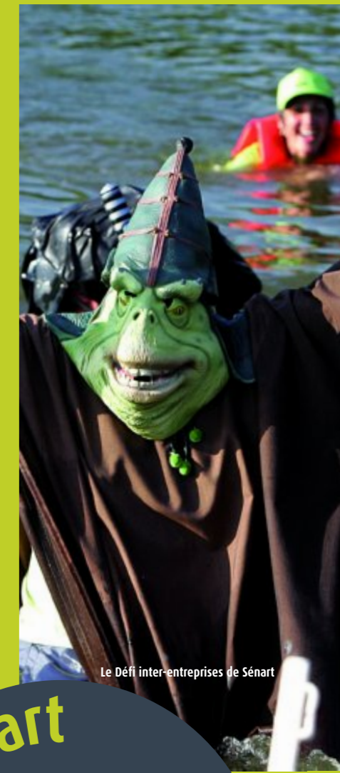
Le Défi inter-entreprises de Sénart